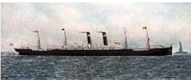
SS Finland: il a transporté des Ortlieb de Beblenheim en 1903